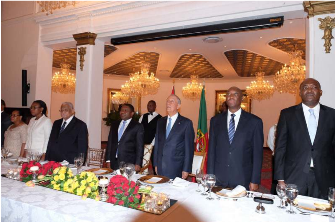
No final da Visita de Estado a Moçambique o Presidente Marcelo Rebelo de Sousa ofereceu um jantar em honra do Presidente da República de Moçambique, Filipe Jacinto Nyusi, e Senhora, no Salão Nobre do Hotel Polana, em Maputo.