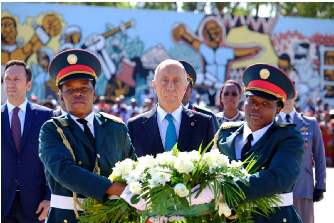
O Presidente Marcelo Rebelo de Sousa depositou uma coroa de flores no Monumento aos Heróis Moçambicanos, na Praça dos Heróis Moçambicanos