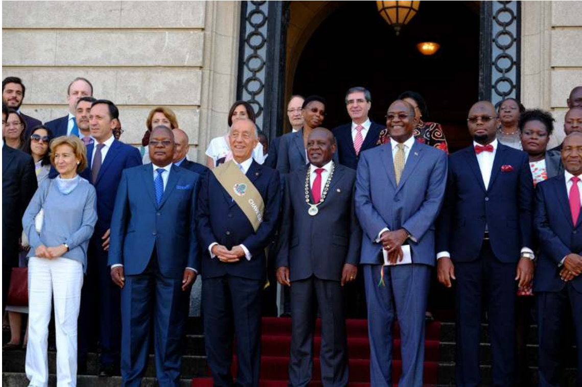
O Presidente da República recebeu a Chave da Cidade de Maputo numa cerimónia realizada no Conselho Municipal de Maputo.