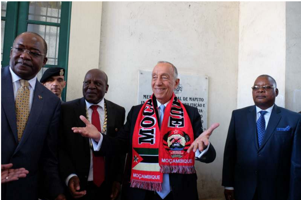
O Presidente Marcelo Rebelo de Sousa visitou o Mercado Municipal de Maputo, onde percorreu as suas típicas bancas de venda.