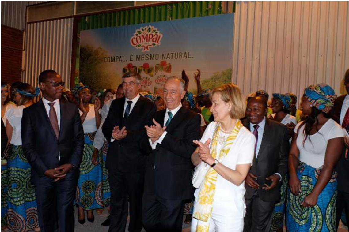
Visita às empresas "Mecwide" e Sumol/Compal