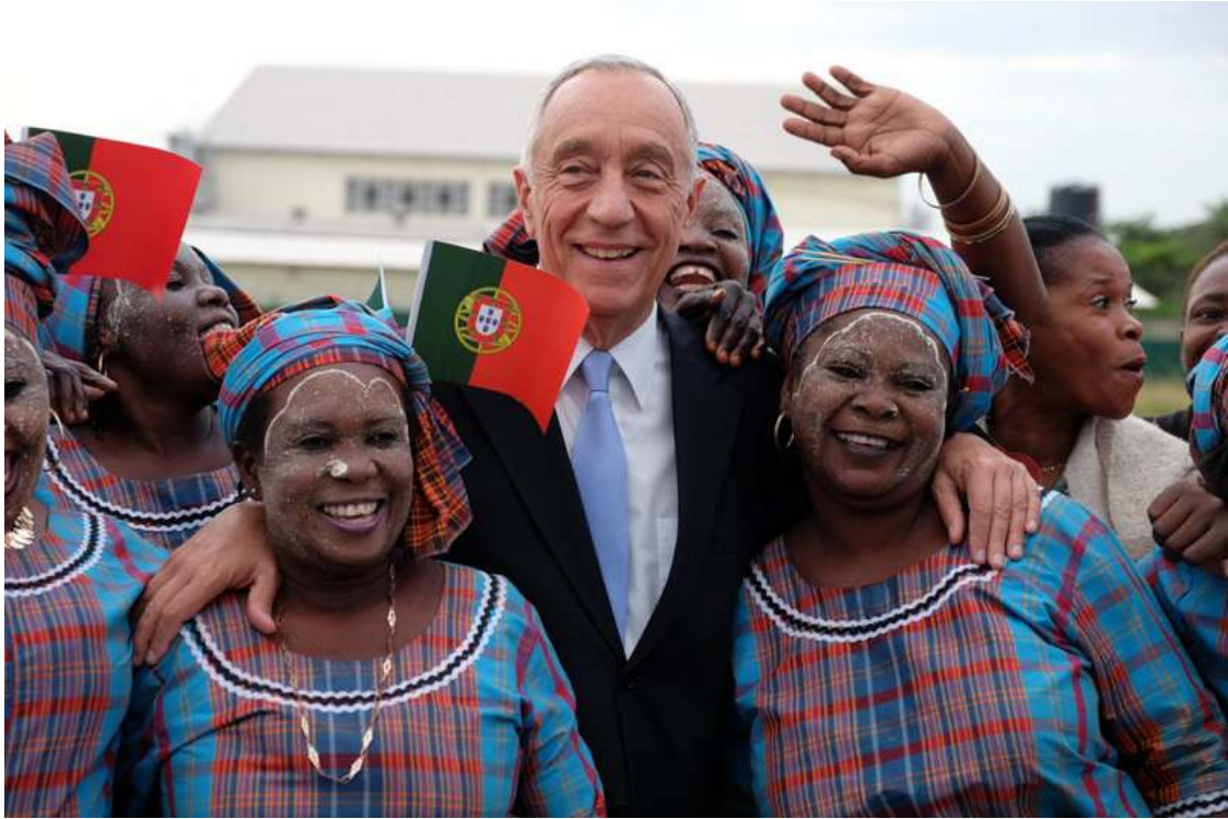
Chegada a Maputo. O Presidente foi recebido no Aeroporto Internacional de Maputo pelas autoridades locais e assistiu à atuação de grupos de dança e cultura tradicional moçambicana.