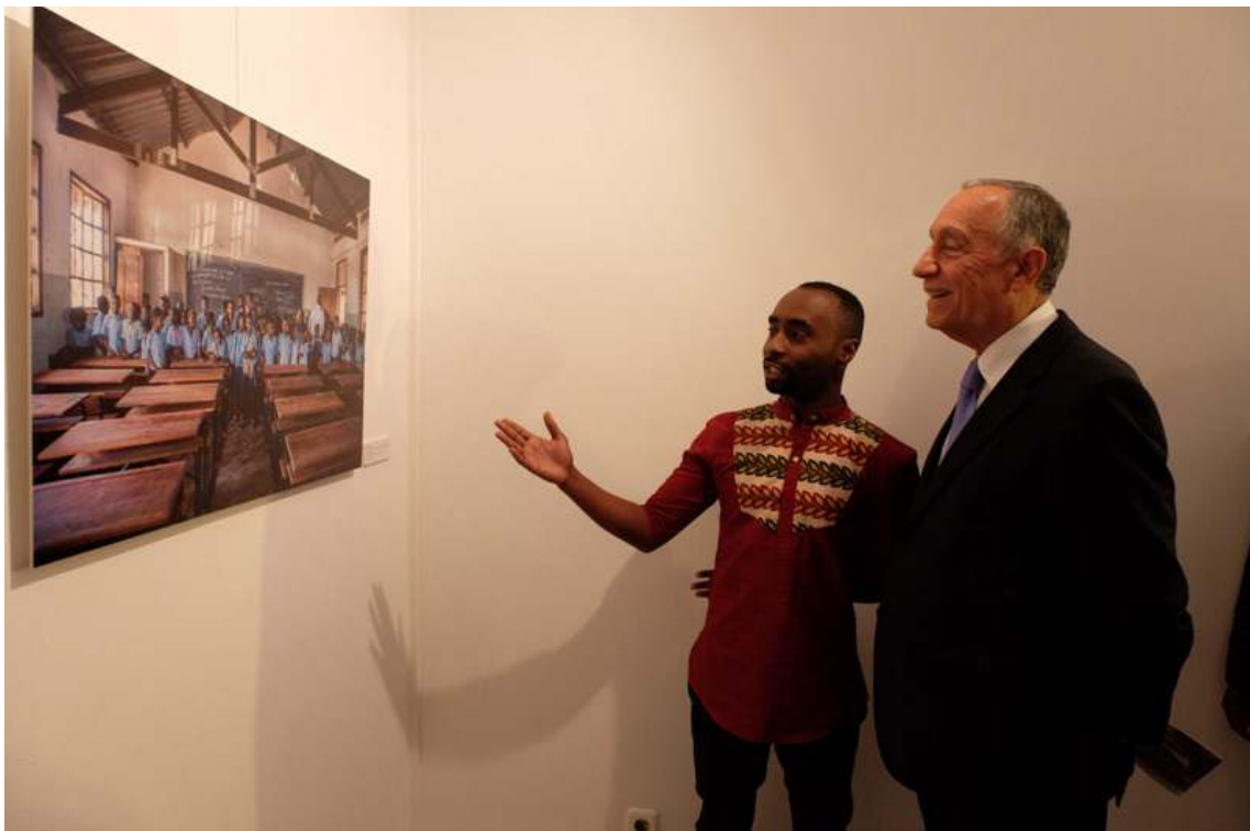
O Presidente Marcelo Rebelo de Sousa inaugurou, no Centro Cultural Português, uma exposição de fotografias do Ministério da Educação de Moçambique. Após a visita à exposição, o Presidente da República encontrou-se com antigos bolseiros moçambicanos da Cooperação Portuguesa que estudaram em universidades portuguesas.