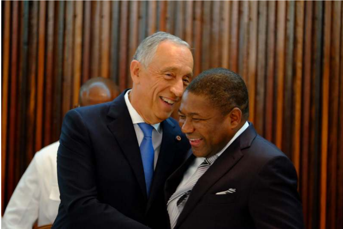
O Presidente da República participou num banquete oferecido, em sua honra, pelo Presidente da República de Moçambique, Filipe Jacinto Nyusi, e Senhora, no Palácio da Ponta Vermelha, em Maputo