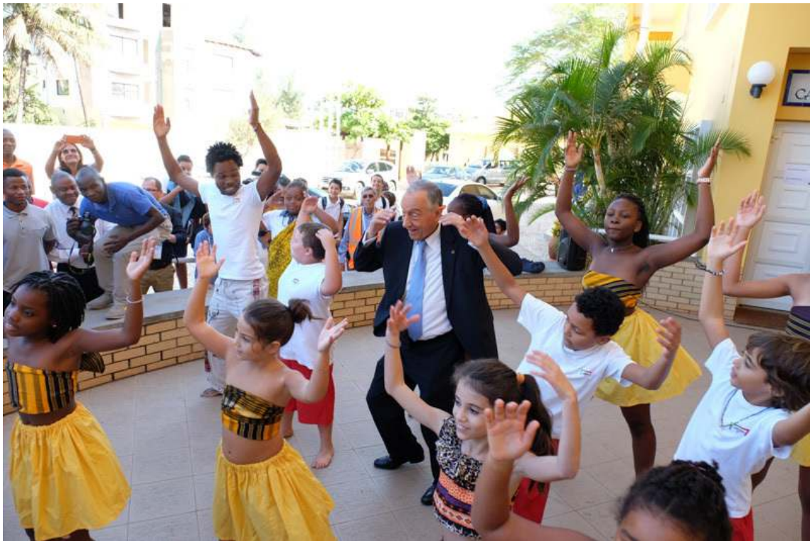
O Presidente Marcelo Rebelo de Sousa visitou, em Maputo, a Escola Portuguesa de Moçambique e a Escola Secundária Estrela Vermelha, tendo percorrido as instalações destes estabelecimentos de ensino e mantido encontros com os alunos e professores