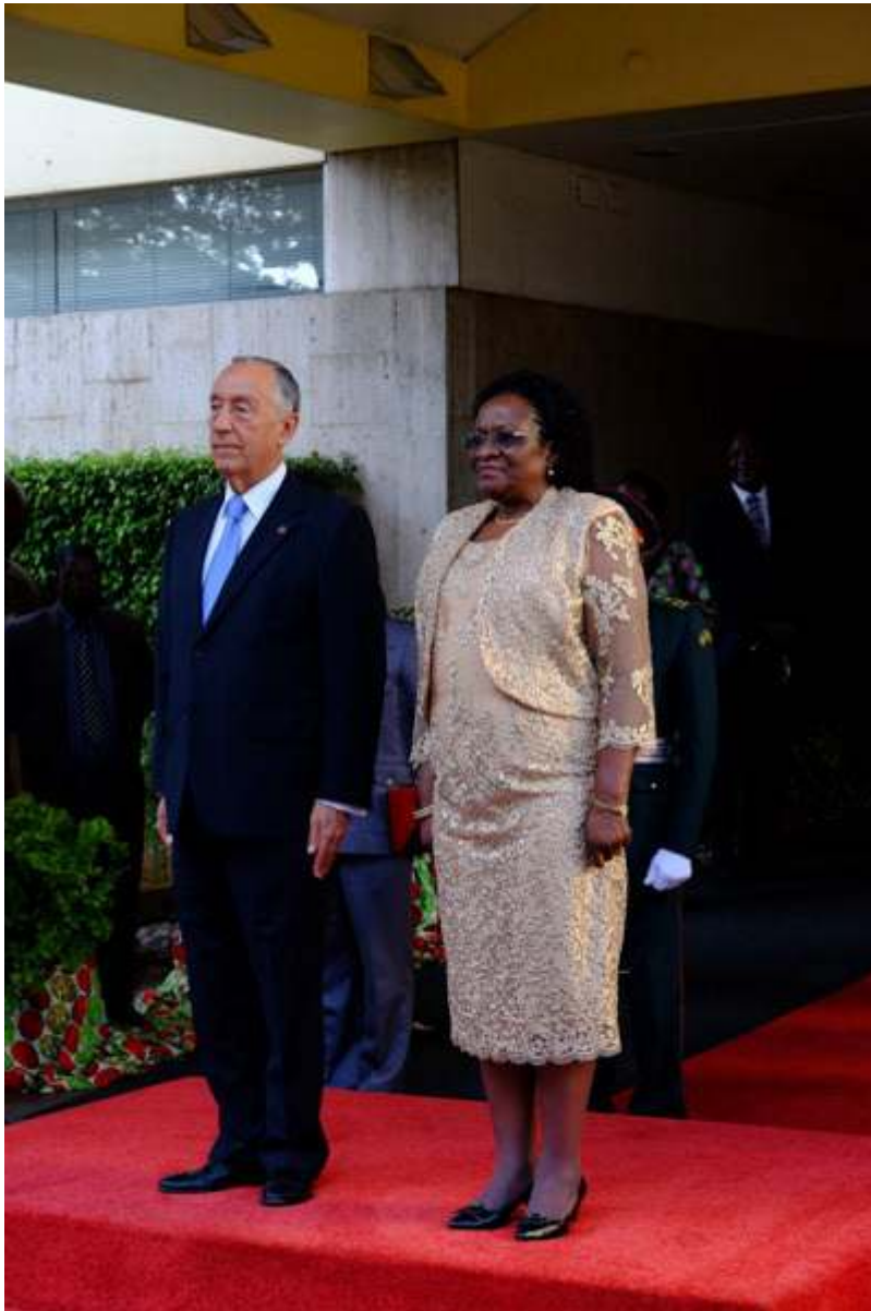
No início do terceiro dia da Visita de Estado a Moçambique, o Presidente Marcelo Rebelo de Sousa visitou a Assembleia da República de Moçambique, onde foi recebido pela sua Presidente, Verónica Nataniel Macamo Dlhovo