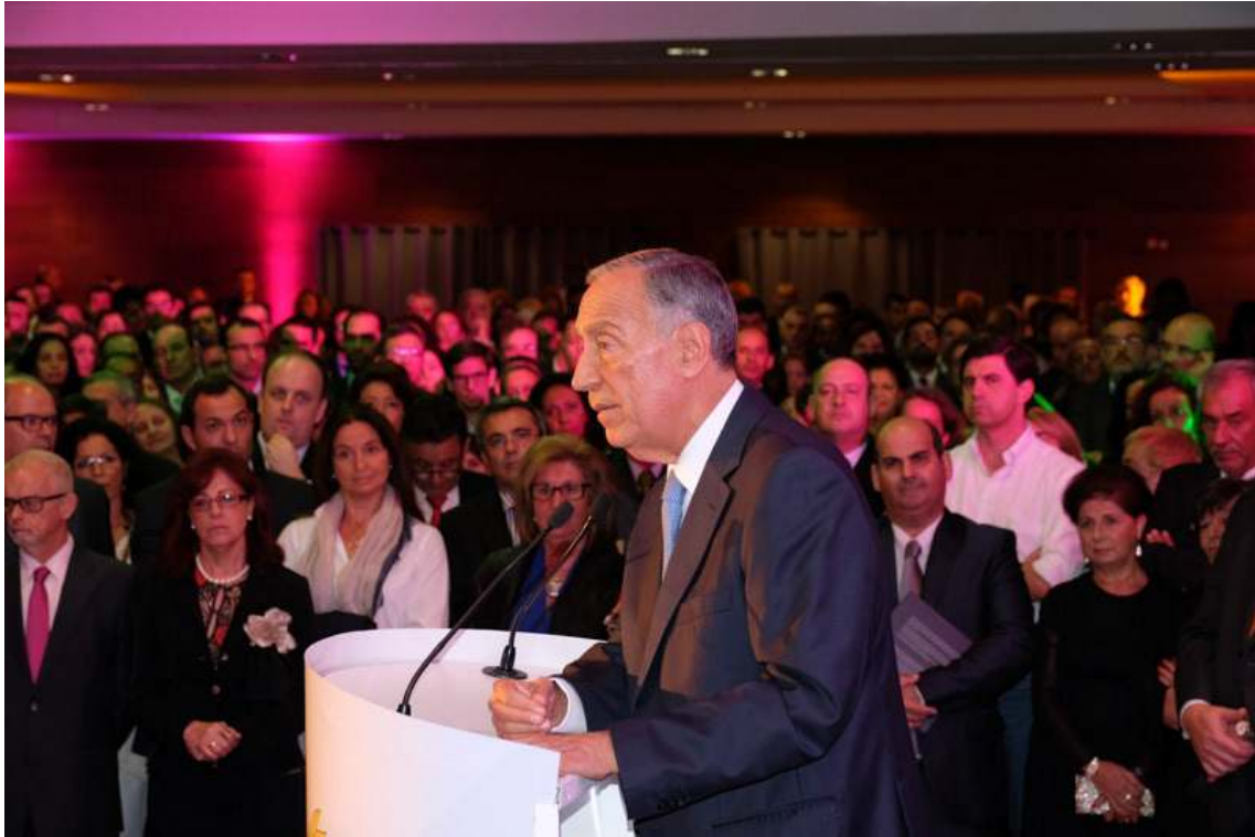
O Presidente Marcelo Rebelo de Sousa encontrou-se com a Comunidade Portuguesa residente em Moçambique, no Hotel Indy Village em Maputo.